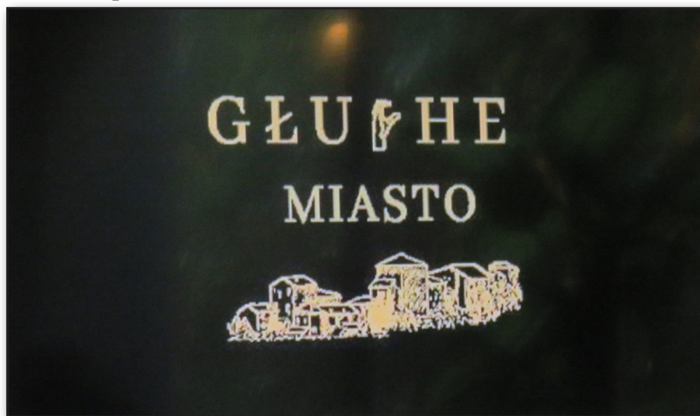
Официално лого на проекта „Глухи град“

и здравна психология, която е и тренъор по личностно развитие;