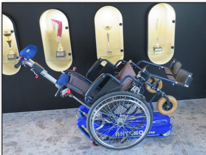
Специална инвалидна количка – „робот за изкачване на стълби“, използвана в Общинска обществена библиотека в град Бихава

Наскоро реновираната сграда на Общинска обществена библиотека “Literary SPA” в град Бихава, която е изградена на 2 етаж и все още не са оборудвани асансьори, за нуждите на хората с нарушена мобилност е набавена специална инвалидна количка, наречена „ робот за изкачване на стълби “. Тя представлява устройство за преодоляване на денивелации, предназначена за инвалидни колички, което се управлява от придружител. То е способно да се движат нагоре и надолу по стълбите, докато човекът с увреждания седнали на инвалидна количка, прикрепена към устройството.