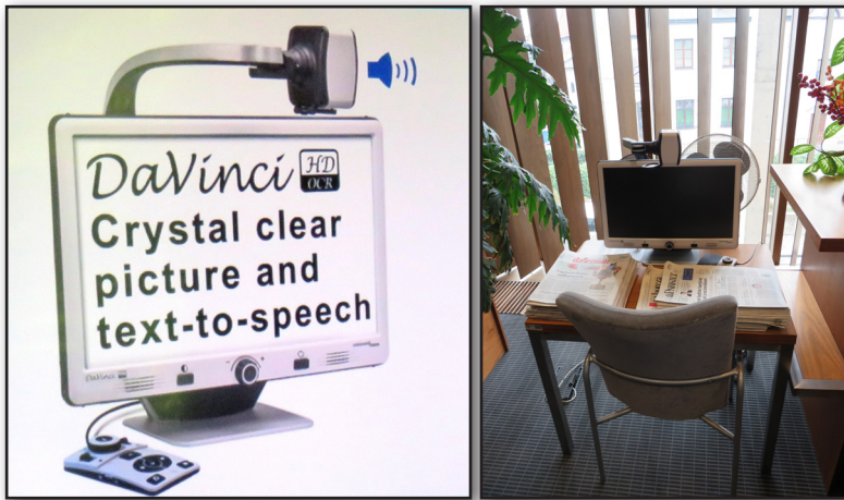
Автоматичен четец за хора със зрителни увреждания “DaVinci Crystal clear picture and text-to-speech”, инсталиран в Люблинската библиотека