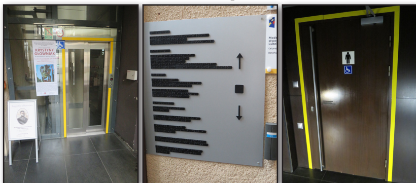
Специализираният асансьор на Люблинската библиотека; брайлова табела, указваща разположението по етажи, на различните отдели, офиси и помещения; входът към специализирания санитарен възел

и дамската тоалетна за хора с увреждания на ниво –1, очертан с жълта лента. Качвайки се с асансьора до ниво +1, ползвателите на инвалидни колички могат да използват читалнята на списанията, където могат да получат всички необходими материали, да използват четеца “da Vinci” за хора с увредено зрение, както и да имат безплатен достъп до Wi-Fi. На външния площад е обособено място за паркиране за хора с увреждания, което е разположено в непосредствена близост до входа на основната сграда;