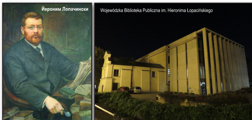
Портрет на Йероним Лопачински – патрон на Провинциалната обществена библиотека на град Люблин и нощна снимка на библиотеката

Провинциална обществена библиотека на град Люблин носи името Йероним Лопачински (1860–1906 г.) 4 , който е виден полски лингвист, етнограф, историк и библиофил. С написаните над 160 научни труда, той е признат за енциклопедист и е член на престижната краковска научна институция „ Академия на обучението “. Въз основа на неговата книжна колекция от над 12 000 тома се формира ядрото на книжната колекция на библиотеката.