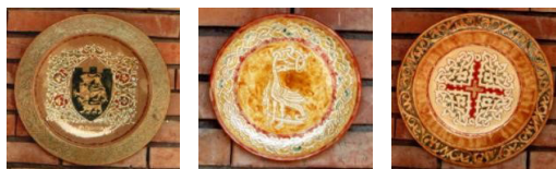
Сн.2 Керамични чинии